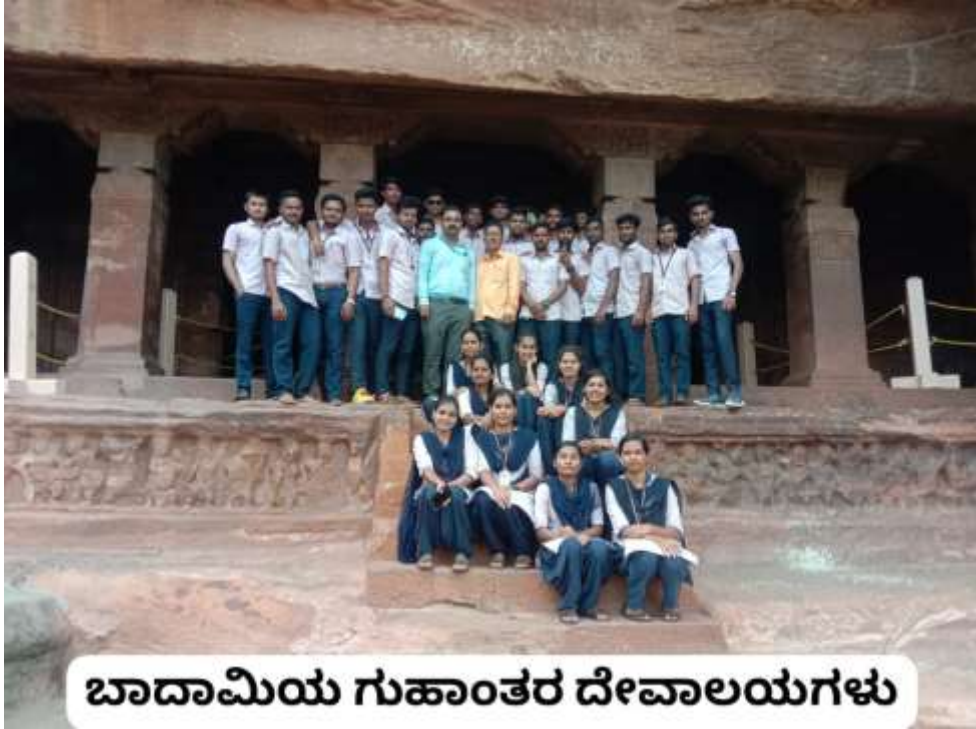
ಬಾದಾಮಿಯ ಗುಹಾಂತರ ದೇವಾಲಯಗಳು