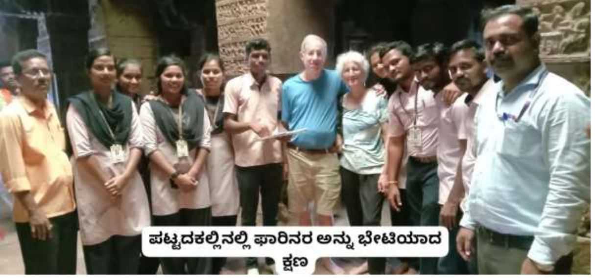
ಪಟ್ಟದಕಲ್ಲಿನಲ್ಲಿ ಫಾರಿನರ ಅನ್ನು ಭೇಟಿಯಾದ ಕ್ಷಣ