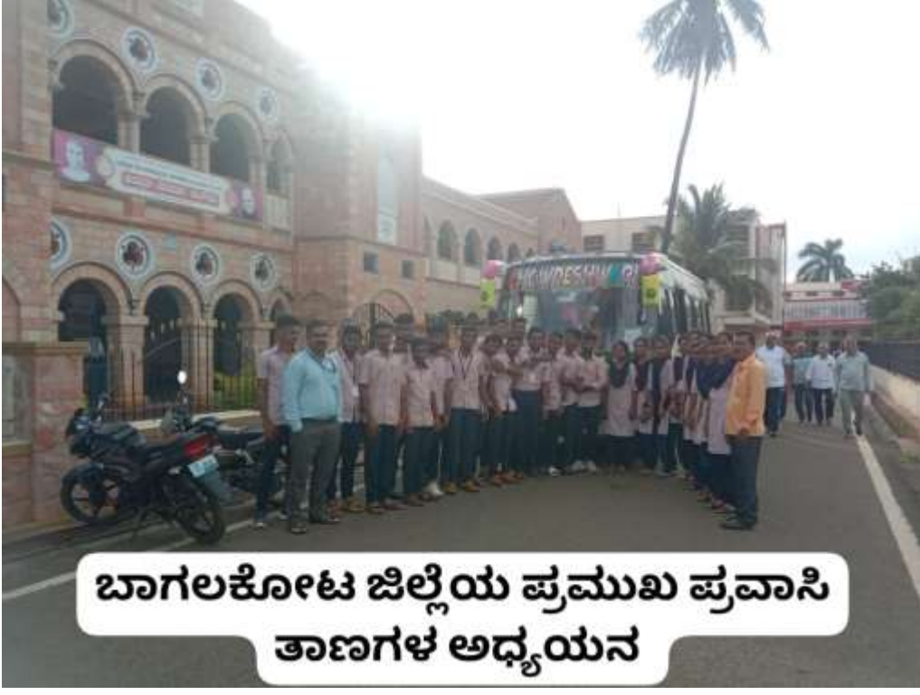
ಬಾಗಲಕೋಟ ಜಿಲ್ಲೆಯ ಪ್ರಮುಖ ಪ್ರವಾಸಿ ತಾಣಗಳ ಅಧ್ಯಯನ