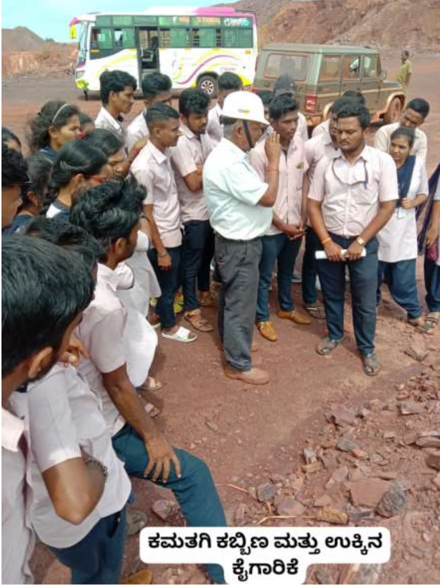
ಕಮತಗಿ ಕಬ್ಬಿಣ ಮತ್ತು ಉಕ್ಕಿನ ಕೈಗಾರಿಕೆ